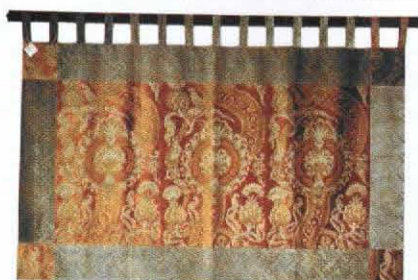
Cuverturi de perete VENEȚIA STUDIUM Material: mătase Diverse modele, culori și dimensiuni Magazin: InStyle Design

S tii deja cum îți vei amenaja fiecare cameră. Acum eliberează-ți fantazia și transformă obiectele simple, sau cu design auster, în piese de mobilier menite să stîrnească emoții și încîntare tie și celor dragi. Canapeaua, patul, masa, scaunele, ferestrele, pot fi îmbrăcate în materiale moi, rezistente, „pictate” cu imprimeuri sofisticate, geometrice sau orientale.