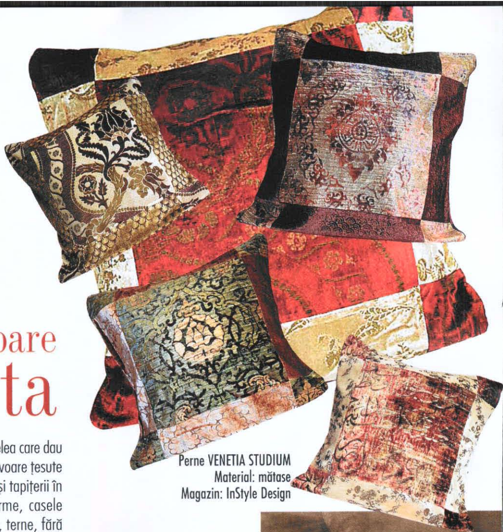
Perne VENETIA STUDIUM Material: mătase Magazin: InStyle Design

Interior VENETIA STUDIUM Lămpi din mătase pictată manual FORTUNY® Concubina Perne și materiale textile din mătase VENETIA STUDIUM Magazin: InStyle Design