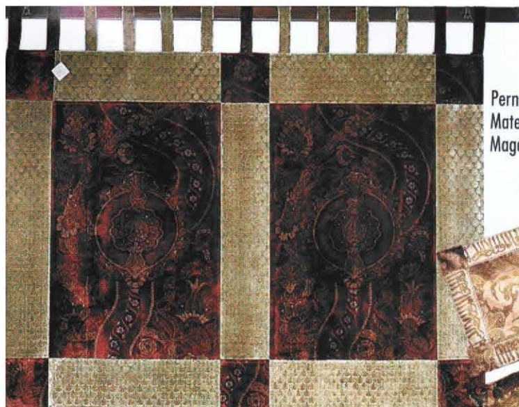
Perne VENEȚIA STUDIUM Material: mătase Magazin: InStyle Design